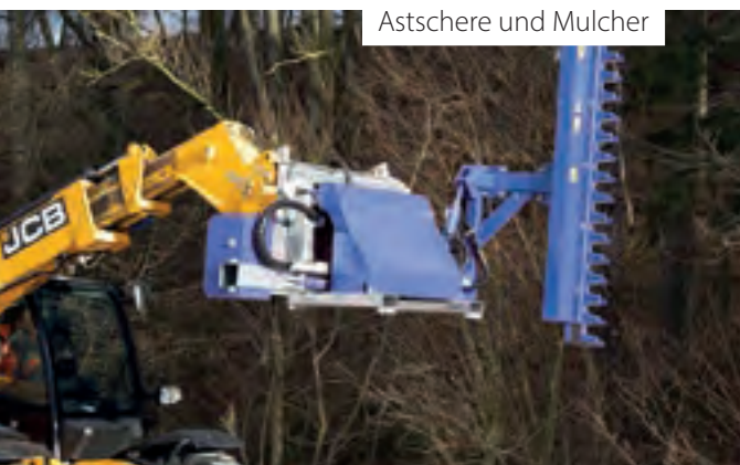
Astschere und Mulcher