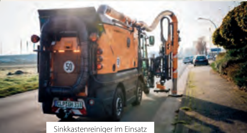
Sinkkastenreiniger im Einsatz