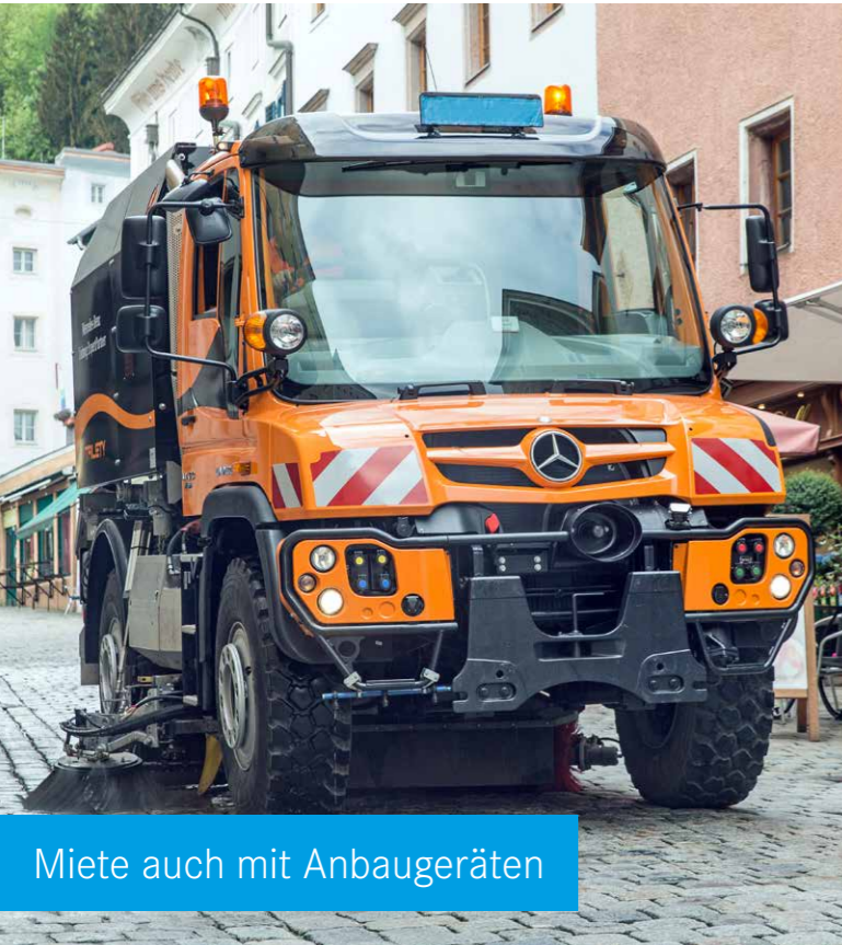
Miete auch mit Anbaugeräten

Mit Unimog EcoRent Plus 5 wirtschaftlich und risikofrei mieten.