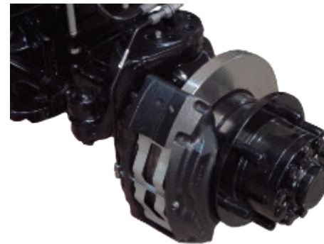
Überdimensionierte Scheibenbremse mit optischer Verschleißanzeige // Oversized disc brake with visible indication