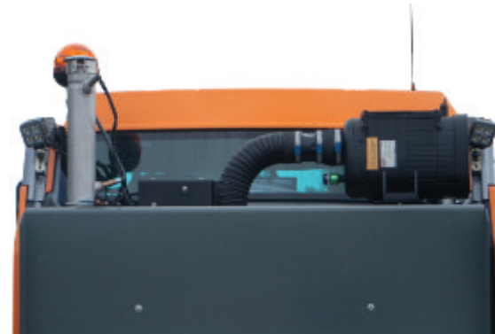
LED-Arbeitsscheinwerfer hinten // LED-rear working lights