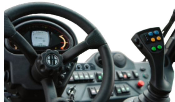
Kombiinstrument mit Serviceanzeige // Combi instrument with service indicator