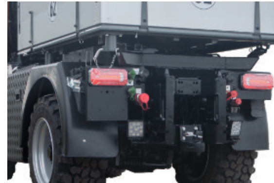
Schwere Anbautraverse zur Aufnahme von Heckenbaugeräten // Lifting beam for picking up rear mounted equipment