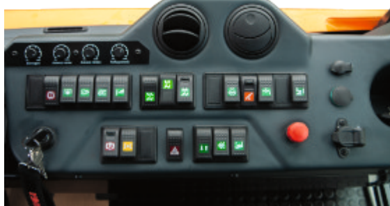
Kundenindividuelles Armaturenbrett // Customized dashboard