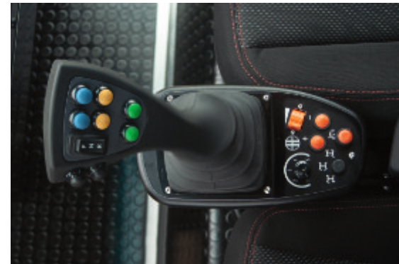
Multifunktionsjoystick inkl. Bedientasten für verschiedene Arbeitsmodi, Lenkungsarten, Tempomat, Handgas sowie Fahrtrichtungsschalter // Multifunctional joystick incl. control buttons for different working modes, different types of steering, cruise control, hand throttle as well as a direction switch