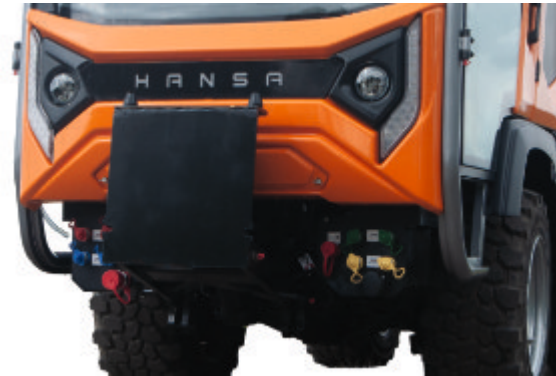
Massive Frontanbauplatte mit Parallelführung // Massive front mounting plate with parallel guide