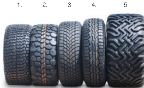
REIFEN // Tires 1. 315 / 55 R 16 Rasenprofil // Lawn profile 2. 315 / 55 R 16 MPT 3. 285 / 65 R 16 4. 265 / 75 R 16 5. 440 / 50 R 17