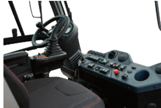
Komfortables Kabinenkonzept inkl. individuell verstellbarer Armlehne // Comfortable driver's cabin incl. an individual adjustable armrest