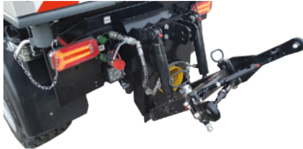
Heck-3-Punkt-Aufnahme mit leistungsstarker Zapfwelle // 3-point-rear-pick-up with powerful PTO shaft