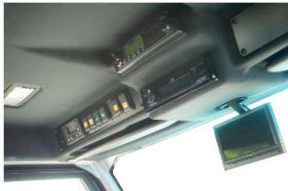
DAB+ Radio mit Bluetooth-Freisprecheinrichtung, Rückfahrkamera // DAB+ radio with bluetooth hands-free module, rearview camera