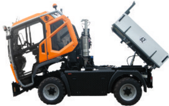
Fahrerhaus und Ladefläche hydraulisch kippbar // Hydraulically tiltable driver's cabin and platform